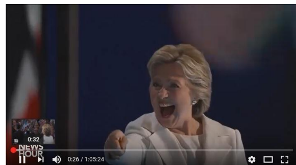
Afbeelding 1: Clinton wijst naar een bekende in het publiek

Ook de wijze waarop Clinton wijst naar een bekend iemand in het publiek en dan lacht, heeft het gevaar van een ingestudeerd gebaar. Een gebaar dat meer beredeneerd dan puur menselijk of authentiek overkomt. En als toevoerder zoeken we altijd de authentieke mens: in zijn eerlijkste eerlijkheid. Als we weten waar iemand écht staat, weten we waar we zelf moeten gaan staan.